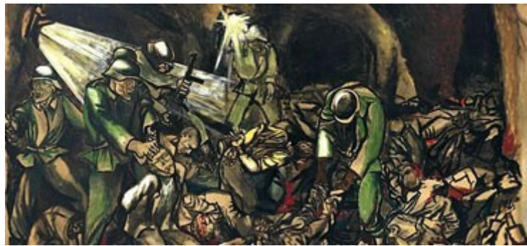
Renato Guttuso, Fosse Ardeatine , 1950.

Nell'ambito del Calendario civile del Bibliopoint Di Vittorio il nostro Istituto propone un percorso di letture e documenti visivi sulla strage delle Fosse Ardeatine, uno degli episodi più tragici della Resistenza italiana al nazifascismo e un evento indelebile nella storia di Roma.